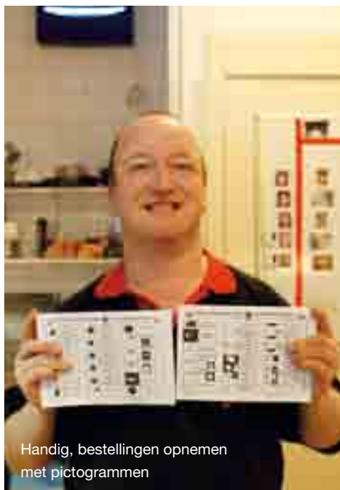
Handig, bestellingen opnemen met pictogrammen