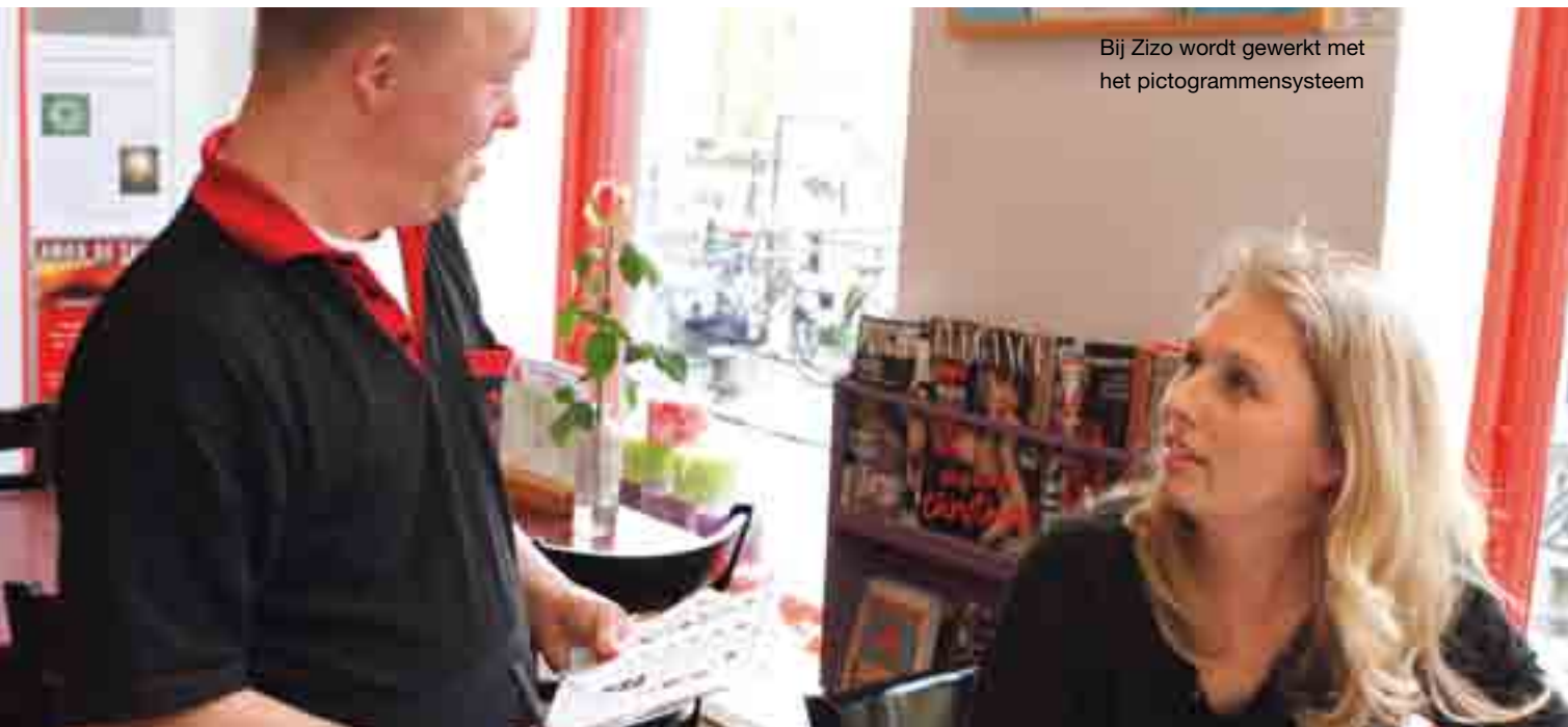
Bij Zizo wordt gewerkt met het pictogrammensysteem