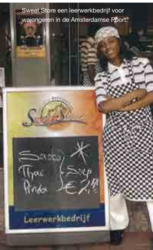
Sweet Store een leerwerkbedrijf voor wajongeren in de Amsterdamse Poort.

kunnen ze ergens anders aan de slag of naar school. Ze krijgen de cateringopleiding OCCB van Sodexo, zodat ze een diploma hebben. Daarnaast geven we ze sociale vaardigheden mee en leren ze omgaan met afspraken, ritme en regelmaat. We zijn veel bezig met herhalen en nog eens herhalen.”