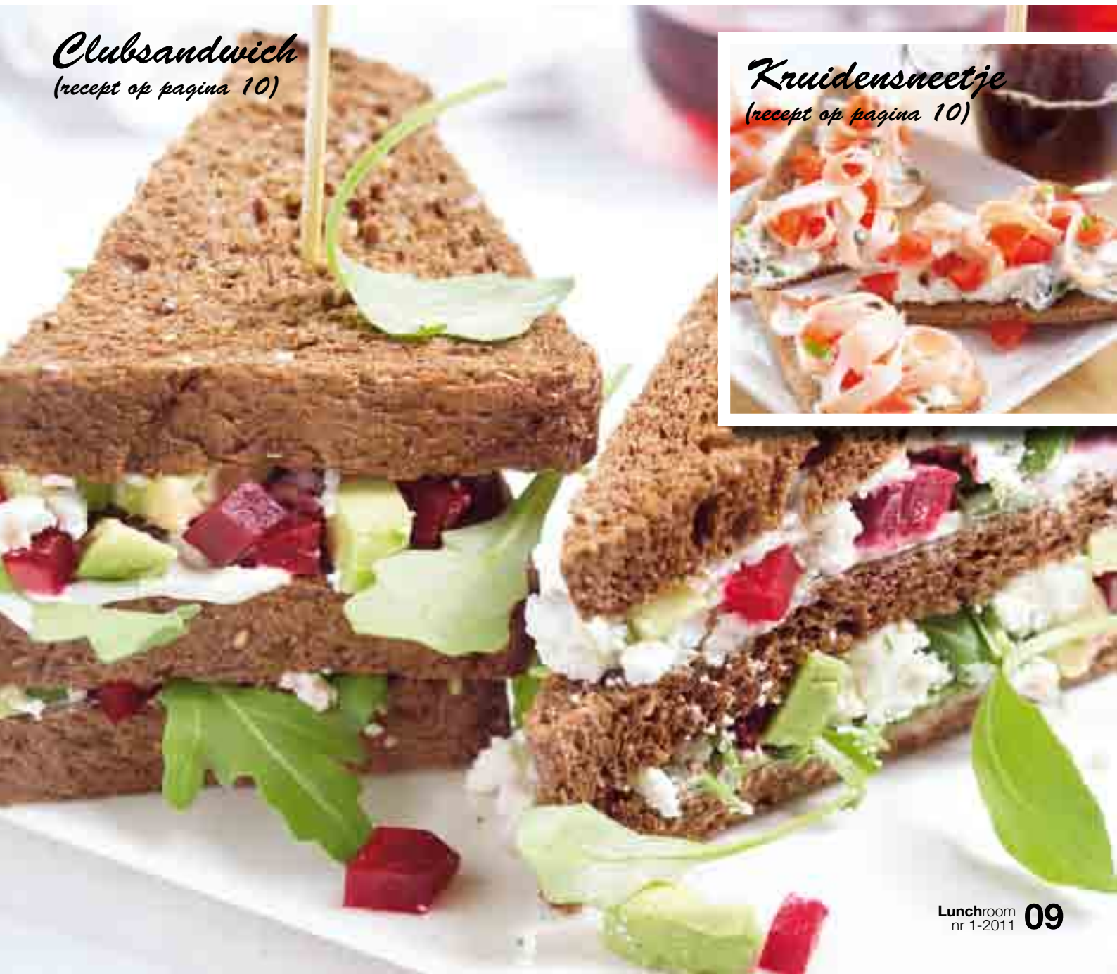
Kruidensneetje (recept op pagina 10)