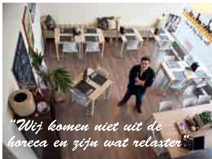
"Wij komen niet uit de horeca en zijn wat relaxter"

"Bij ons heeft de klant in principe altijd gelijk. We hebben kortingsacties met coupons zodat mensen twee high teas voor de prijs van één krijgen. Juist deze klant die hier voor kostprijs zit te eten, klaagt over van alles en nog wat, terwijl wij ons erbij neer leggen dat we dan niets verdienen. Laatst bestelde een mevrouw jus d'orange. Ze zei dat we Appelsientje schonken, aangengelnd met water en suiker. Dan laten we haar in de keuken gewoon de sinaasappelschillen zien en geven we haar een tweede glaasje jus. Daar moet je niet te moeilijk over doen."